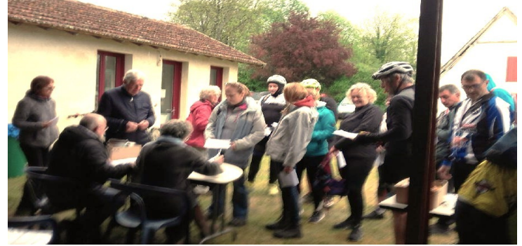
En avril : plein succès, malgré la pluie, des randos pédestre et VTT plus de 120 inscrits