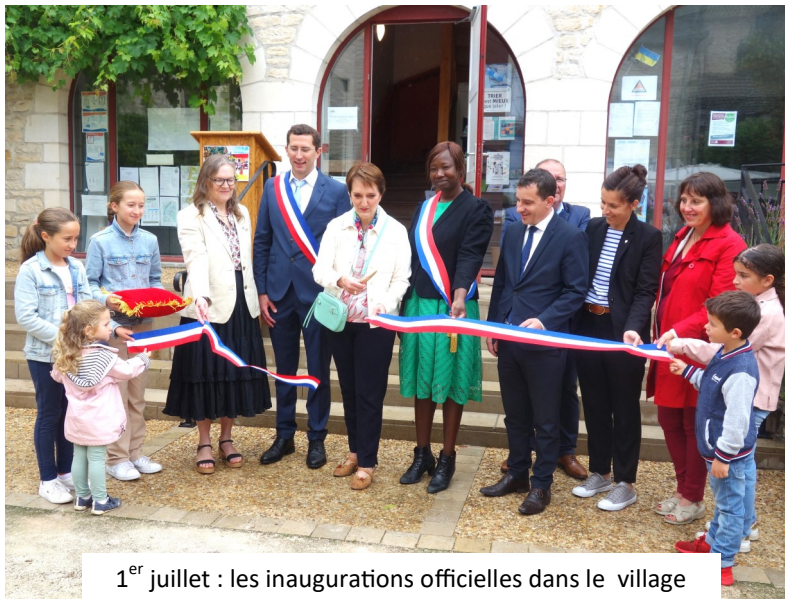
1 er juillet : les inaugurations officielles dans le village