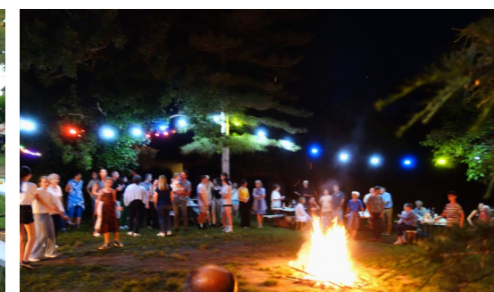
23 juin : Feu de la St Jean : réussite de l'évènement grâce au beau temps, la bonne humeur et l'implication de tous