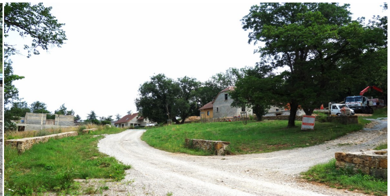
En juin : à la Rondelle, Installation d'une borne et d'une citerne incendie souple pour le Barry du Fraysse où 4 nouvelles maisons sortent de terre