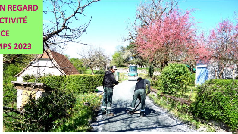
« La croix teulière » Les poteaux disparaissent, les lignes électriques sont enterrées, la rue bénéficie d'un nouveau revêtement